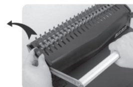
(Рис 7.) Когда все листы вставлены, отпустите замок фиксации гребёнки и поднимите ручку в исходное положение