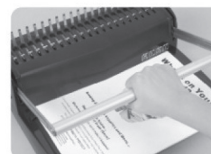
(Рис 4.) Опустите ручку вниз до упора полностью пробив стопу бумаги