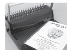
(Рис 8.) Извлеките готовый буклет.