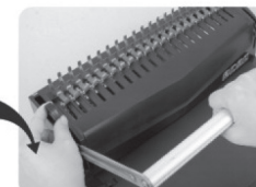
(Рис 5.) Вставьте и откройте пружинку. Надавите на фиксатор гребёнки, чтобы зафиксировать её в нужном положении