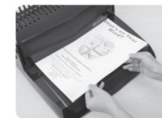
(Рис 3.) Вставьте в приёмный слот бумагу ( макс. 12 листов 70-80 г/м 2 за 1 раз)