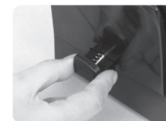
(Рис 2.) Установите регулятор глубины перфорации в положение от 2 до 5 мм