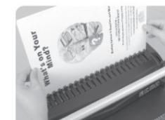
(Рис 6.) Поместите перфорированную бумажную стопу в открытую пружинку